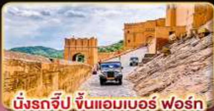
เมืองจิป ขึ้นแอมเบอร์ ฟอรั่ม