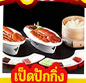
เปิดปีกกึ่ง