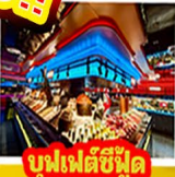
บูฟเฟต์ซีฟู้ด