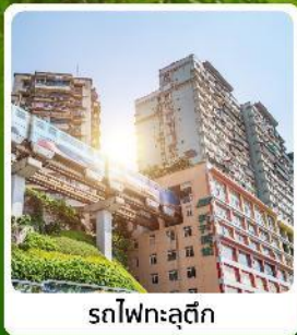
รถไฟฟ้าสุดึก