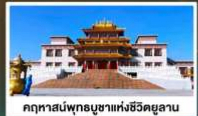
คฤหาสน์พุทธบูชาแห่งชีวิตยูลาน