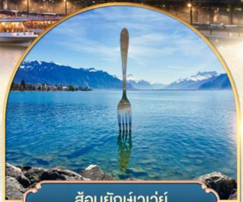
ส้อมยักเข่าเว่ย