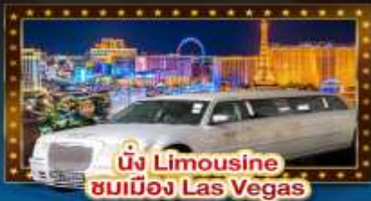
นั่ง Limousine ชมเมือง Las Vegas