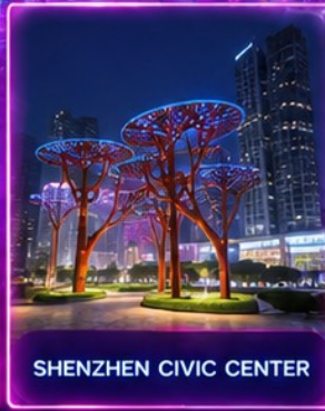
SHENZHEN CIVIC CENTER