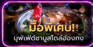
มือพิเศษ! บุฟเฟ่ต์ชาบูสุโตส์ฮ่องกง

UpperHills จุดถ่ายรูปสุดชิบของวัยรุ่นเซินเจิ้น - OCT Loft ย่าน Creative Park - OCT Harbour Happy Coast - Shenzhen Bay Culture Plaza - Cyberpunk พิพิธภัณฑ์ศิลปะร่วมสมัยเซินเจิ้น (MOCAPE) - Joy City Center (One Avenue) - Shenzhen Civic Center - shigu garden - วัดเจ้าแม่กวนอิม - วัดแชกงหมิว