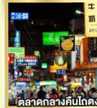
ตลาดกลางคืนโกตง