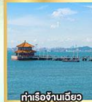
ท่าเรือจันเจียว