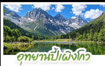
อุทยานป่าผึ้งโกว

อุทยานสีดรุณี • อุทยานป่าผึ้งโกว • เมืองตุเจียงเยียน รูปปั้นหมีแพนด้าอนเซลฟ์ • ร้านหนังสือจุงชูก่อ • วัดต้าอิว ถนนโบราณชอยกว้างชอยแคบ • ถนนคนเดินซุนซึลู่ • ถนนไท่กู่หลี่ หมีแพนด้าปับติก IFS • ชมแสงสีน้ำพุไม้ไผ่ตัก SKP • ชมตึกแฝดเจิ้งตุ