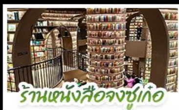
ร้านหนังสือจุงชูก่อ