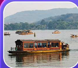
“ล่องเรือทะเลสาบซีหู”