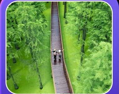
“ป่าสนชิงซาน”

T2G-HGH01GJ Welcome Hangzhou...หังโจว ฉู่โจว ฉู่หยวน ช่างเหรา หุบเขาเทวดา 5D 4N (GJ)