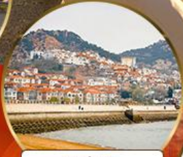
ซาจี้โข่ว