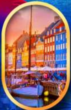
ท่าเรือบูชวาน์