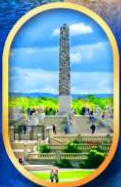
วิกเกอร์แลนด์