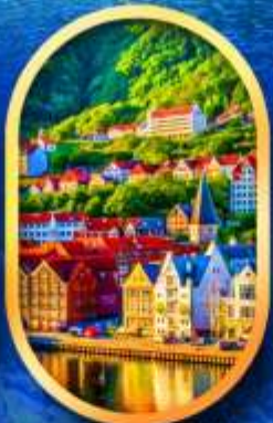
พิกเมืองเบอร์เก็น