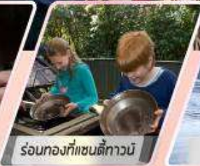
ร้อนท้องที่แซนดี้ทาวน์