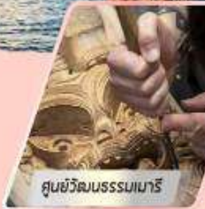
ศูนย์วัฒนธรรมเมารี