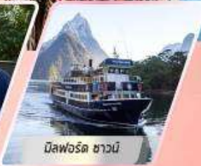
มิสฟอร์ด ซาวน์