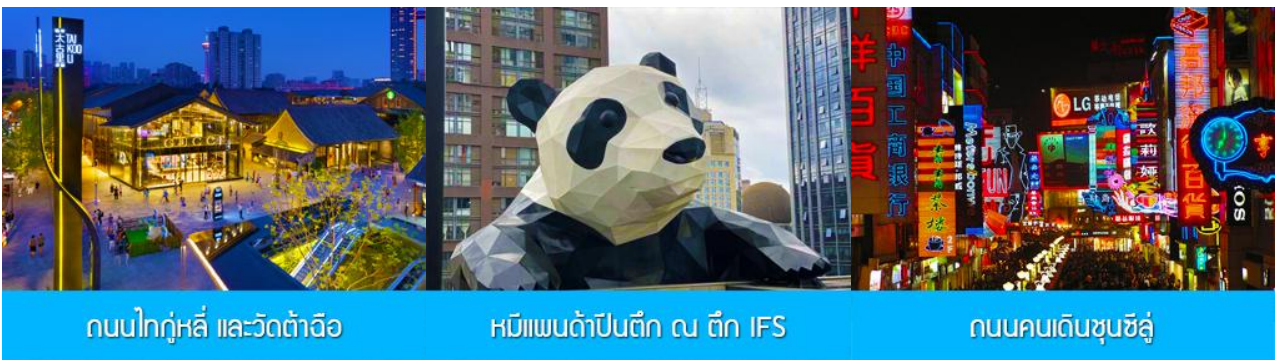
ถนนไท่กู่หลี่ และวัดต้าฉือ