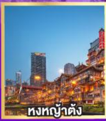
หงทงย้งต้ง

เที่ยวเต็มอิ่ม..ไม่ลงร้านช้อปปิ้ง นั่งรถไฟความเร็วสูง 2 เที่ยว ไม่มีออฟชั่นเพิ่ม