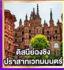
คิสบีย้งฉง ปราสาทเวทมนตร์