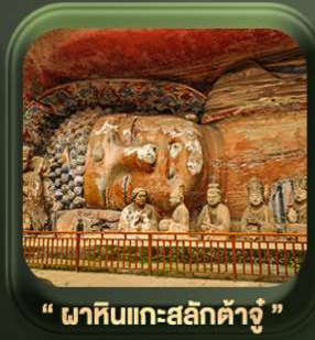
“ พาทินแกะสลักต้าจู้ ”