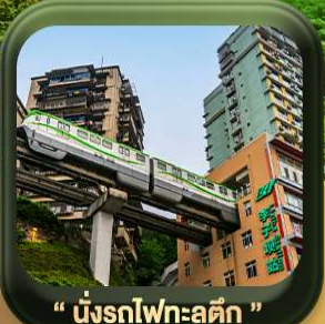
“ นั้งรถไฟทะลุตึก ”

บินตรงลงวงซิ่ง • อุ้หลง หลุมฟ้าสะพานสวรรค์ • ระเบียงแก้ว • อุทยานเขานางฟ้า หงหยาดัง • นั้งรถไฟทะลุตึก • ศาลาประชาม (ด้านนอก) • หลงหมินฮ่าว มรดกโลกพาทินแกะสลักต้าจู้ • วัดหลิวอัน • ตึกตะเกียบ • ถนนคนเดินเจียฟ้างเปี่ย