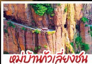
หมู่บ้านทิวสียงซุน