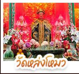
วัดเสล่งไฉมว

นังรกรงพืดแตรมสู่ TOP OF PEAK • ซ้อปบั้งจูงมกทัก และ CITYGATE OUTLAETS • นังกระซ่านองบั้ง สีกการะพระโหญ่เทียนถาน • จอพรเจ้าแม่หล่งโหมว แมงอง 5 มังกร ใ้ประสบความสำเร็จในทุกๆ ค้าน