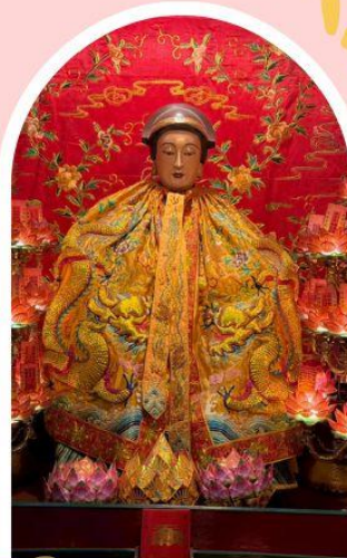
วัดหล่งโหมว

ความสำเร็จ ความมั่งคั่ง เงินทองไหลมาเทมา