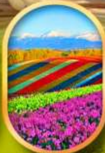
สวนดอกไม้ชิชิโซ