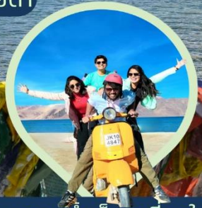
ทะเลสาบน้ำเค็มสูงที่สุดในโลก แปงกอง