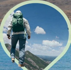
สวยสะกดทุกวิว ไปให้เห็นด้วยตา แล้วใช้ใจ...จดจำ