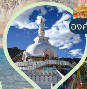
เจดีย์สันติภาพ