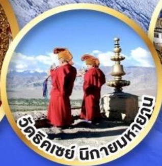
วัดริคเชย์ นิกายมหายาน