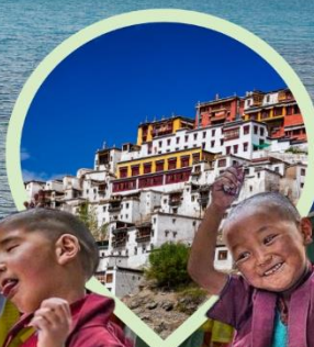
วัดริเบตนิคายมหายาน หมวกแดง หมวกเหลือง