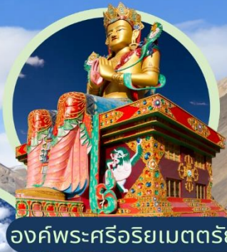
องค์พระศรีอริยเมตตรัย