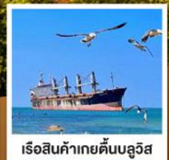
เรือสินค้าเกย์ตันบลูวิส