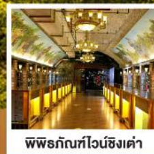
พิพิธภัณฑ์ไวน์ชิงเต่า