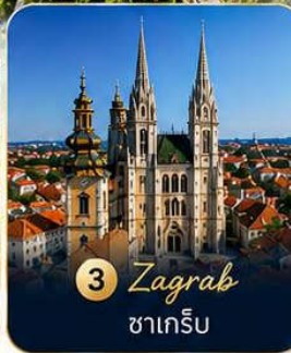
3 Zagreb ซาเกร็บ