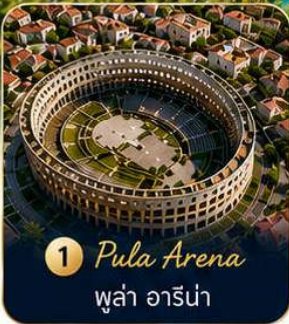
1 Pula Arena พู่ลา อารีน่า