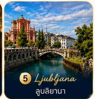
5 Ljubljana ลูบลียานา